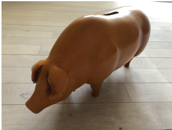
Min sparegris fra 1940 af rød gul keramik