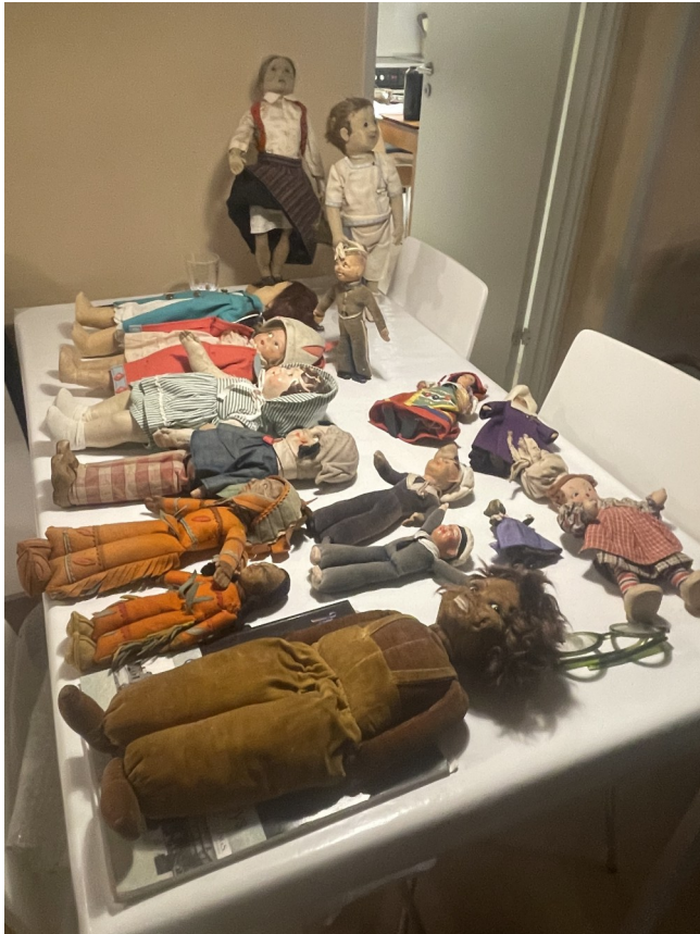
Annes samling af forskellige producenter