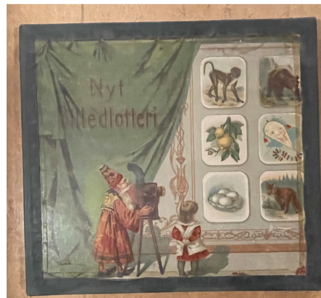
Forsiden af Birgittes billedlotteri