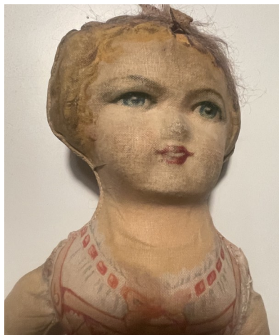
Ullas stofdukke på tryk