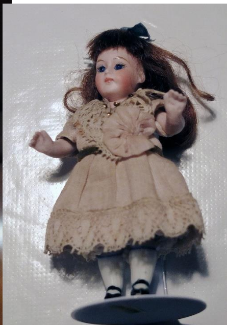
Kirstens nye all-bisque dukke