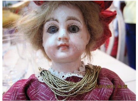
(0237a) og (236a) dukke med revne