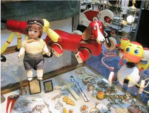
(0211a) Små dukker fra Zengraff