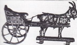
No. 8640. Gig, gepolstert, mit Ziege, in feiner Ausführung, Länge 40 47 cm M. 3,25 4,75 62 cm M. 7,50