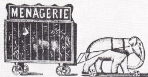
No. 8642. Menageriewagen mit Elefantengespann, M. 0,95