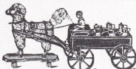
No. 8641. Milchwagen aus Holz, mit Pudel, Länge 45 50 cm M. 4,25 5,25