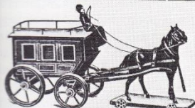
No. 8159. Postwagen aus Holz, mit Pferd und Postillon, 2 Grössen, M. 1,85, 2,60