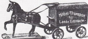
No. 8644. Möbelwagen aus Holz, mit Pferd, M. 1,25, 2,90