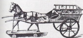
No. 8643. Kabriolett aus Holz, mit Pferd, 2 Grössen, M. 2,90, 4,75