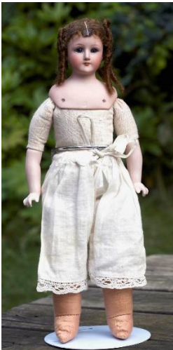
Little woman 22 cm høj Simon & Halbig 1160-0 Stofkrop med underben af stof Fra begyndelsen 1900-tallet