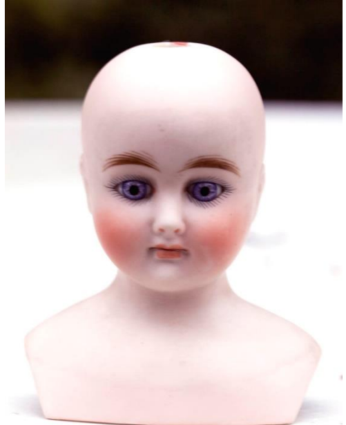
Skulderhoved med hul til at sætte håret fast i. (såkaldt Belton type)

Hun er mærket 5 (måske Kestler) 44 cm høj Hun er 11 cm høj, fin kvalitet og smukke øjne Læderkrop med celluloid arme og læderben Originalt undertøj, forklæde og hat