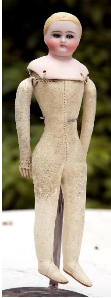
Dreng Ca. 37 cm høj Læderkrop uden led Han er fra efter 1870 og før 1900