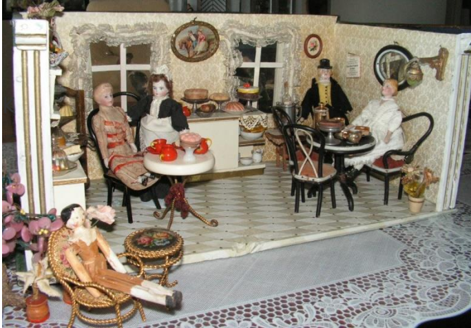
Café de Paris