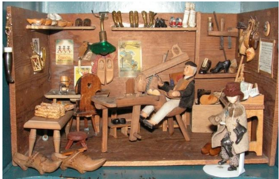
Skomager ved sin læst