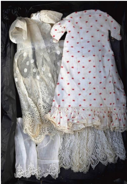
Lille China fra Conta & Böhme. 25 cm. 2 kjoler