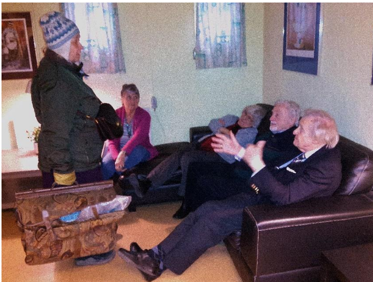
Hygge i den bløde sofa - efter mødet