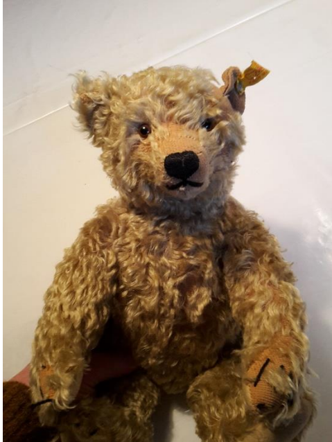
Birgits Steiff bamse