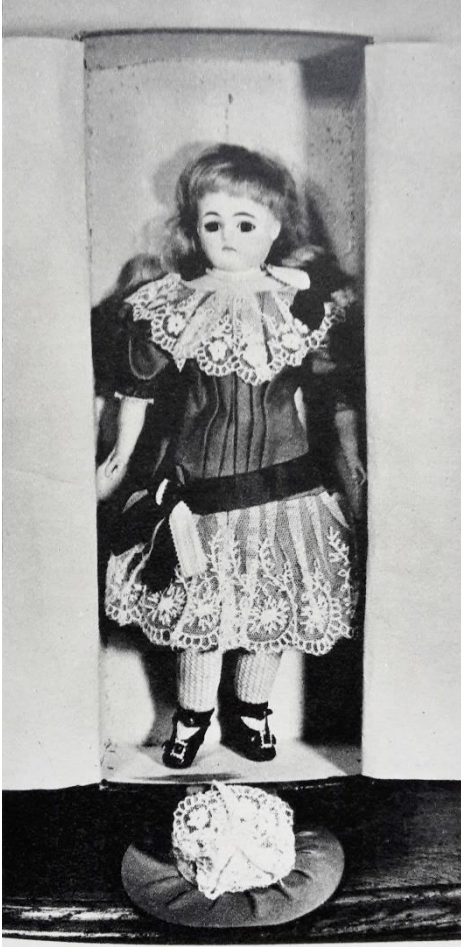
Dukke Klara i Estrid Fauerholdts bog.