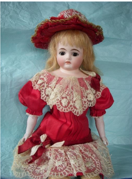
Klaras ankomst 2013