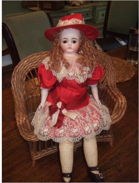
Ruby Lane forår 2013