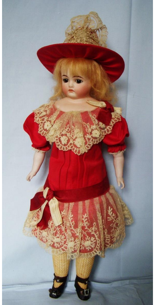
Dukke Klara som hun ser ud i dag