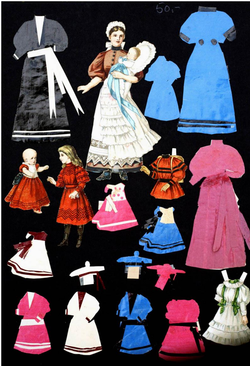
Amme med 3 børn fra 1870 eller senere. De havde meget lidt originalt tøj, så jeg har selv lavet noget af glanspapir og foldet det fint.