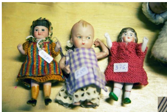
Tre små all-bisque fra Vivette