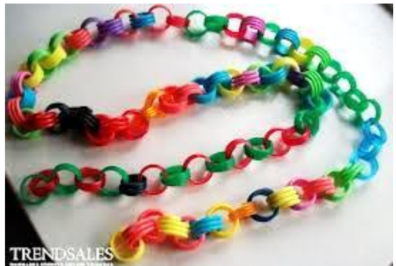
Foto af de hønseringe, som man kan købe i dag.